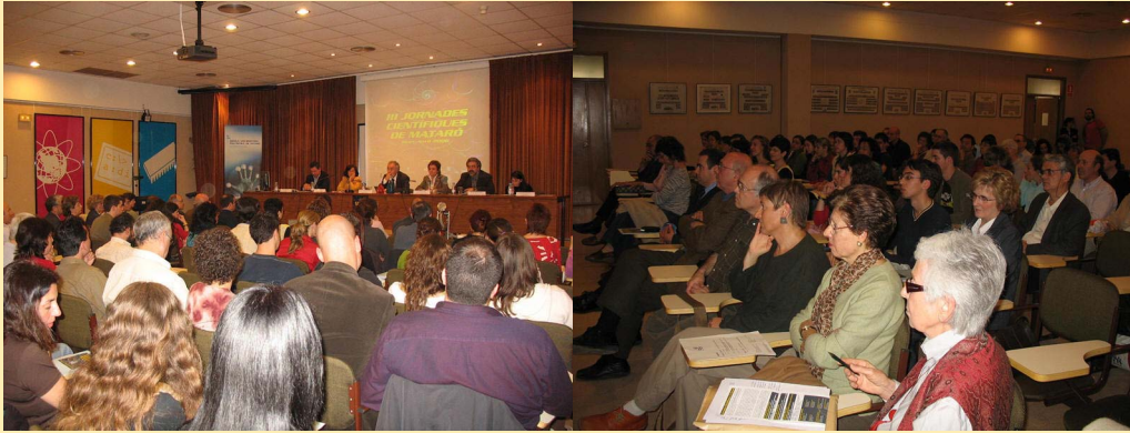
Inauguració de les Jornades