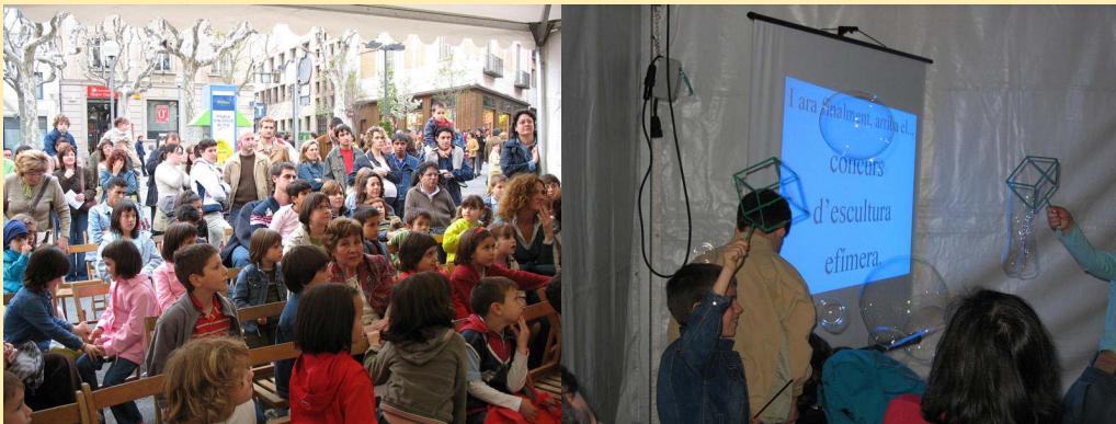
Ciència al carrer

Seria desitjable que més iniciatives d'aquesta mena s'estenguessin pel territori. Si algun dels nostres companys s'hi anima podeu demanar informació a l' Associació .