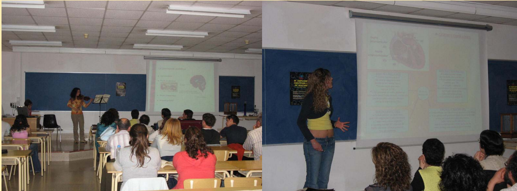
Presentació de treballs