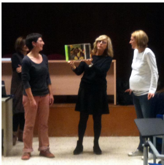
Figura 5. Imatge d'activitat on dos participants situats a costats oposats del cub veuen diferents parts de la imatge i intenten arribar acords sobre el contingut, adonant-se de la riquesa que comporta la conversa exploratòria constructiva.

Les actituds per a la competència discursiva. L'objectiu d'una conversa en general, i especialment a l'aula, és aconseguir una comprensió conjunta, arribar a acords, i això només serà possible, si es té la voluntat i l'actitud d'explorar i comprendre el discurs dels altres, en un clima de cordialitat i confiança. Cal compartir explícitament amb l'alumnat la necessitat de crear aquest clima. Les activitats cinèsiques que exploren la comunicació no verbal poden ser una bona estratègia per comprendre i interioritzar aquestes actituds: demanar als alumnes que representin amb les mans com un joc de forces contràries l'oposició entre dos arguments, o explorar conjuntament la imatge que conté un cub del que cada participant veu només una part, els portarà a percebre que cada persona pot tenir perspectives diferents sobre una mateixa temàtica o situació, i que la visió multifocal que proporciona la interacció conversacional entre els membres d'un grup sempre aportarà una mirada més àmplia, rica i complexa que la mirada individual; que cal avançar en la percepció que les discrepàncies són una oportunitat, i no una amenaça, per aprendre i completar les diferents cares d'un mateix prisma. Incorporar el treball de la presa de consciència de la complexitat permetrà als aprenents a anar teixint un entramat de noves actituds, necessàries per intervenir en debats i controvèrsies per comprendre els fenòmens del nostre món complex, canviant i incert.