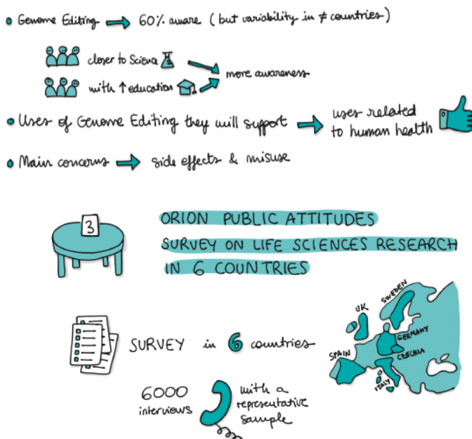
Figura 2. Laura Olivares Boldu. Genome Editing Public Engagement Synergy.