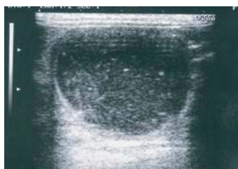
Figura 2A: Imagen ecográfica transversal de un asa intestinal dilatada con contenido hipocogénico.