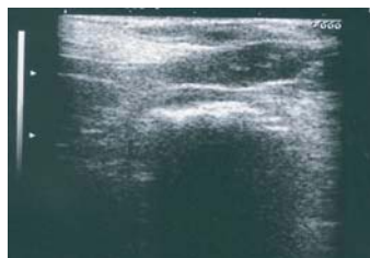
Figura 2B: Imagen ecografía donde se observa un asa intestinal que contiene una estructura alargada rugosa hiperecogénica con sombra acústica.