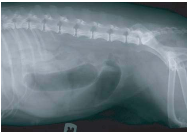
Figura 1A: Radiografía lateral del abdomen.