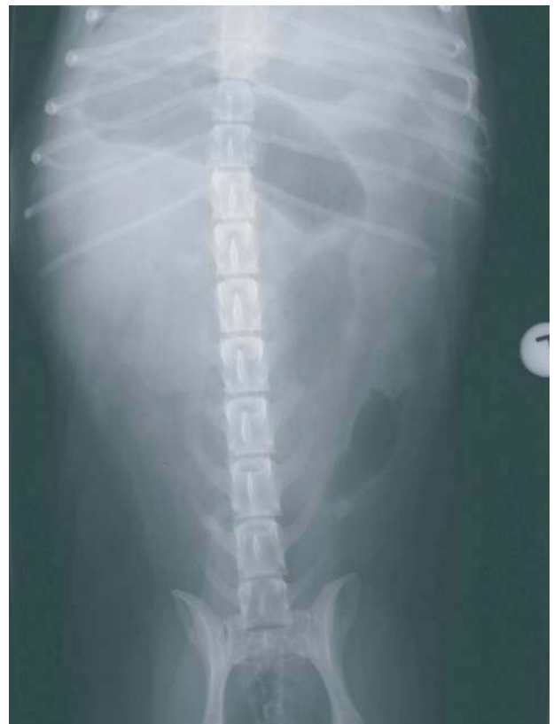
Figura 1B: Radiografía ventrodorsal del abdomen.