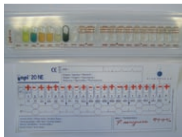
Figura 2. Identificación de una cepa de Pseudomonas spp. mediante la galería comercial API NE (Oxoid)