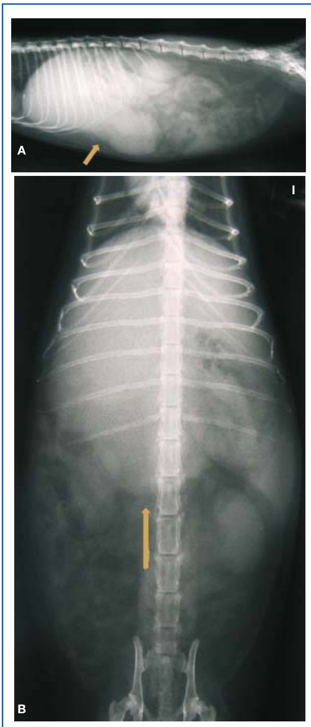
Figura 2. Radiografía lateral (A) y Ventrodorsal (B). Se observa un aumento de tamaño de la silueta hepática con bordes redondeados (flecha) desplazando el estómago caudal y dorsalmente y las asas intestinales caudalmente. I: Izquierda.

Veterinarias, S.A.) 2 mg/kg/12h y ampicilina (Bri-tapen® jarabe 250 mg/5 ml, Laboratorio Reig Jofré, S.A., Barcelona) 25 mg/kg/8h y como procinético, metoclopramida (Primperan gotas 2.6 mg/ml, Sano-fi-Aventis S.A., Barcelona) 1 mg/kg/8h vía oral. Los propietarios acuden a la consulta 48 horas más