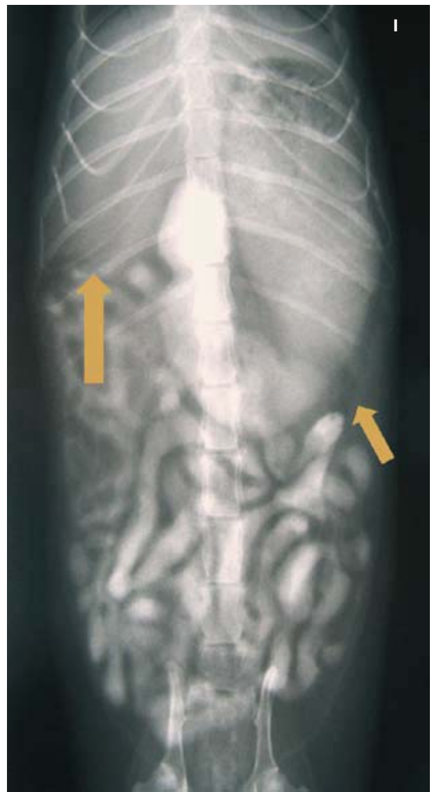
Figura 1. Radiografía Ventro Dorsal realizada a los 40 minutos tras la administración de 8 ml de iohexol (Omnitrast® 240 mg I/ml, Química Farmacéutica Bayer, S.L, Barcelona). Podemos apreciar distensión gástrica con retraso en vaciado gástrico (flechas). I: Izquierda.

Tras un día de hospitalización, el animal se da de alta con el siguiente tratamiento: enrofloxacin (Xedden® 15 mg comp, Divasa-Farmavic, S.A., Barcelona) 7,5 mg/kg/12h, ampicilina (Britapen® jarabe 250 mg/5 ml, Laboratorio Reig Jofré, S.A., Barcelona) 25 mg/kg/8h, ácido ursodeoxicólico (Ursochol® 150 mg comp., Laboratorios Zambon S.A.U., Barcelona) 15 mg/kg/día, S-adenosilmetionina + Silibina (Hepatosil Plus®, Farmadiet Veterinaria, Banyoles) 62 mg/6 mg 1 vez día. Un mes más tarde, el examen