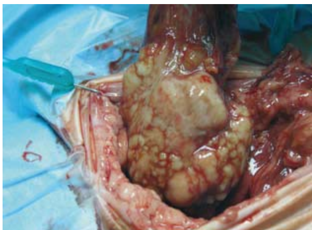
Figura 4. Lobectomía hepática. Se observa una masa ocupando la mayor parte del lóbulo medial derecho.