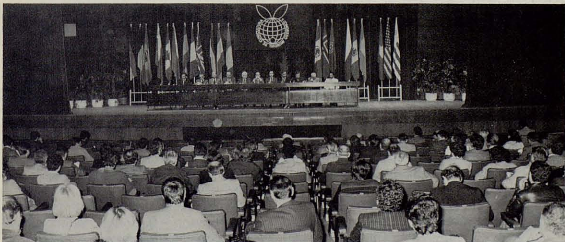
Aspecto de la Sala de Actos del Palacio de Congresos durante el acto inaugural.