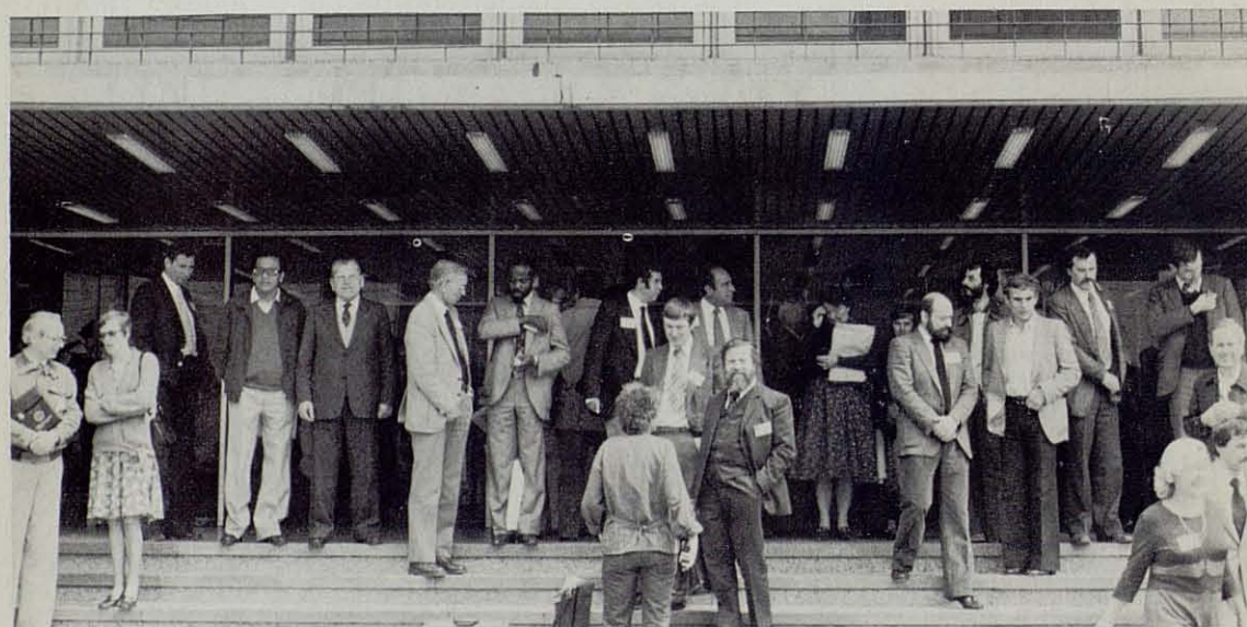
Descanso en las apretadas sesiones.