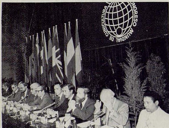
La Mesa Presidencial durante el acto de apertura del Congreso.