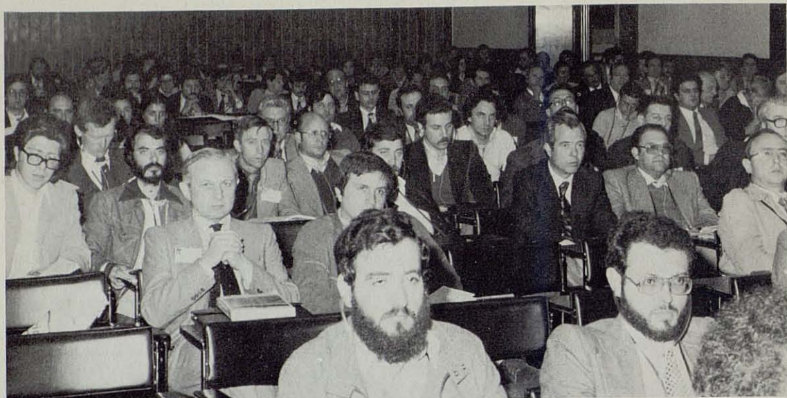
Unos 400 especialistas asistieron a las diferentes sesiones del Congreso.