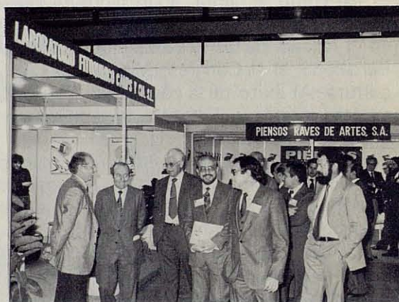
Visita de las autoridades a la Exposición Técnica de cunicultura.