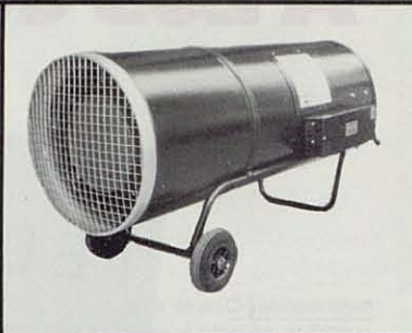
SERIE DE. Calefactores por aire móviles y colgables, con capacidades desde 40.000 a 160.000 Kcal/h. Combustión directa, a gasóleo o gas.

Estos equipos harán más rentable su negocio.