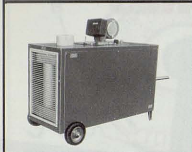
SERIE K. Generadores de aire caliente a gasóleo, con chimenea, móviles o colgables, con gran intercambiador de calor de gran rendimiento. Capacidades de 23.000 a 100.000 Kcal/h.