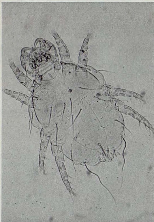
Fig. 3. Cheyletiella parasitivorax.

picadura (Mead-Briggs A.R. & Hugles A.M., 1965). Las infestaciones múltiples evidencian la frecuente asociación en 40 sujetos de P. cuniculi , L. gibbus y C. parasitivorax en un mismo animal; en algunos de los lepóridos