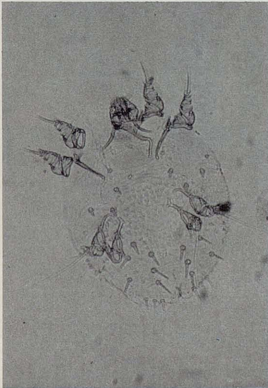
Fig. 1. Sarcoptes scabiei (var. cuniculi ).

con zonas alopécicas y marcado aumento del espesor cutáneo, con una cifra aproximada de 5.000 ácaros por cada conejo; el Leporacarus gibbus y la Cheyletiella parasitivorax fueron encontrados sobre todo en el pelo del dorso y de los flancos con disminución de la brillantez del pelo y pérdida de escamas cutáneas, con un máximo entre 800 y 400 ácaros por conejo respectivamente.