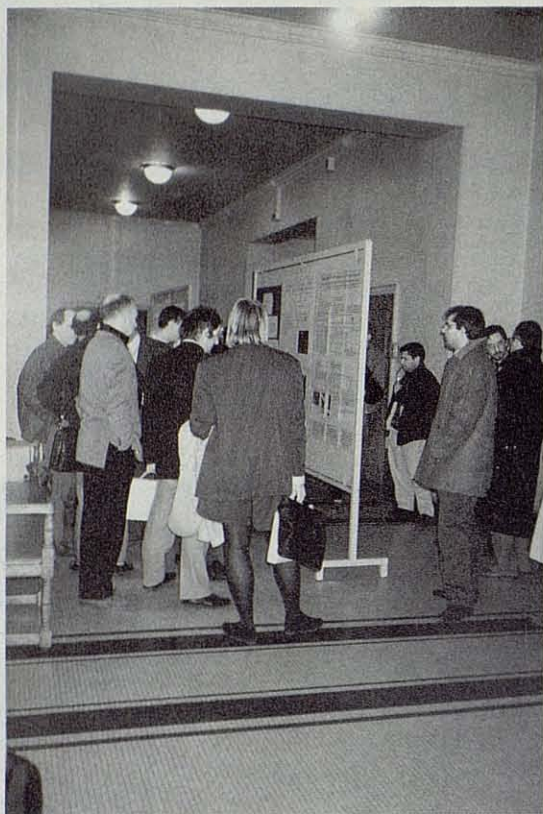
Momento de la presentación de los posters.

-del INRA de Toulouse-, y posteriormente 2 comunicaciones, ambas francesas.