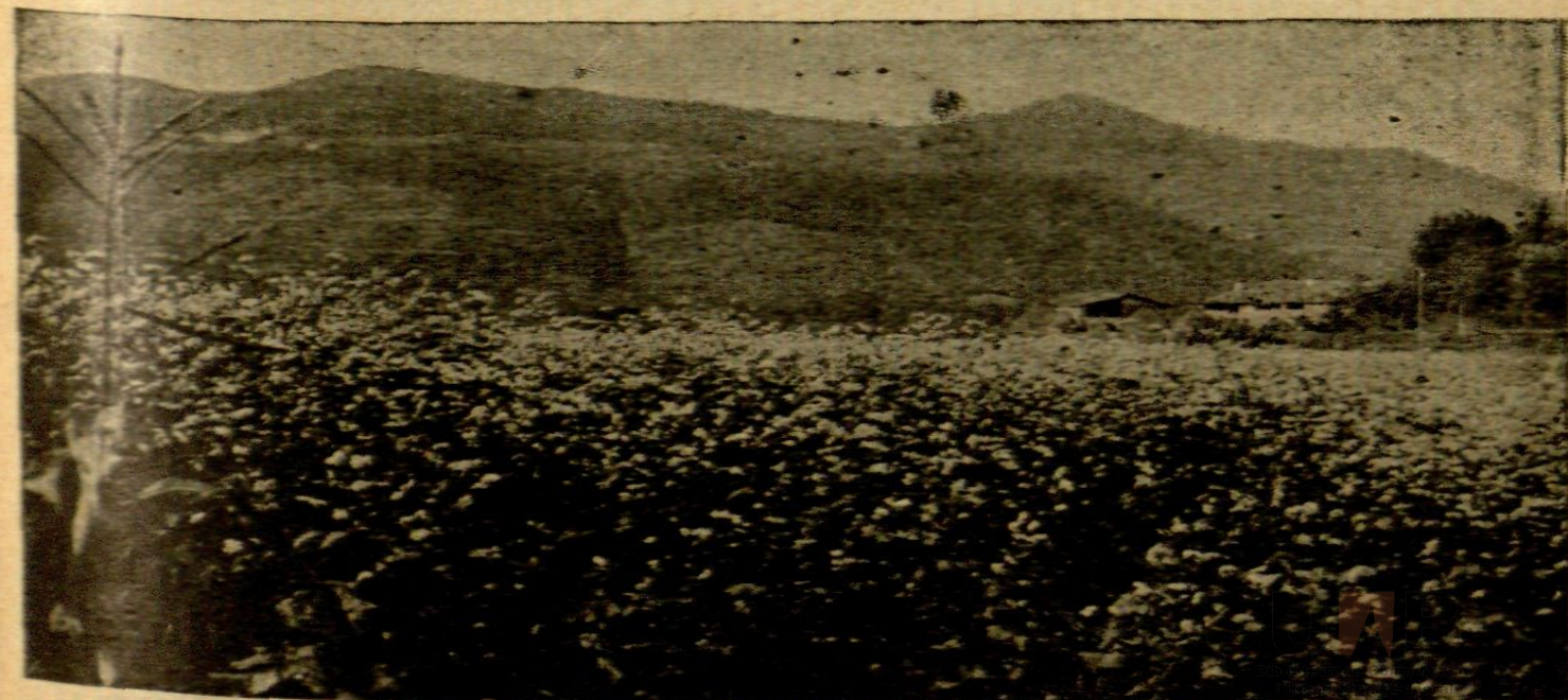
Camp de fajol.