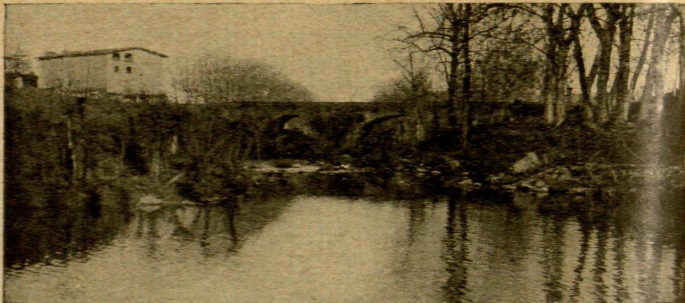
El Pasteral. - Pont de la carretera sobre el riu Ter.