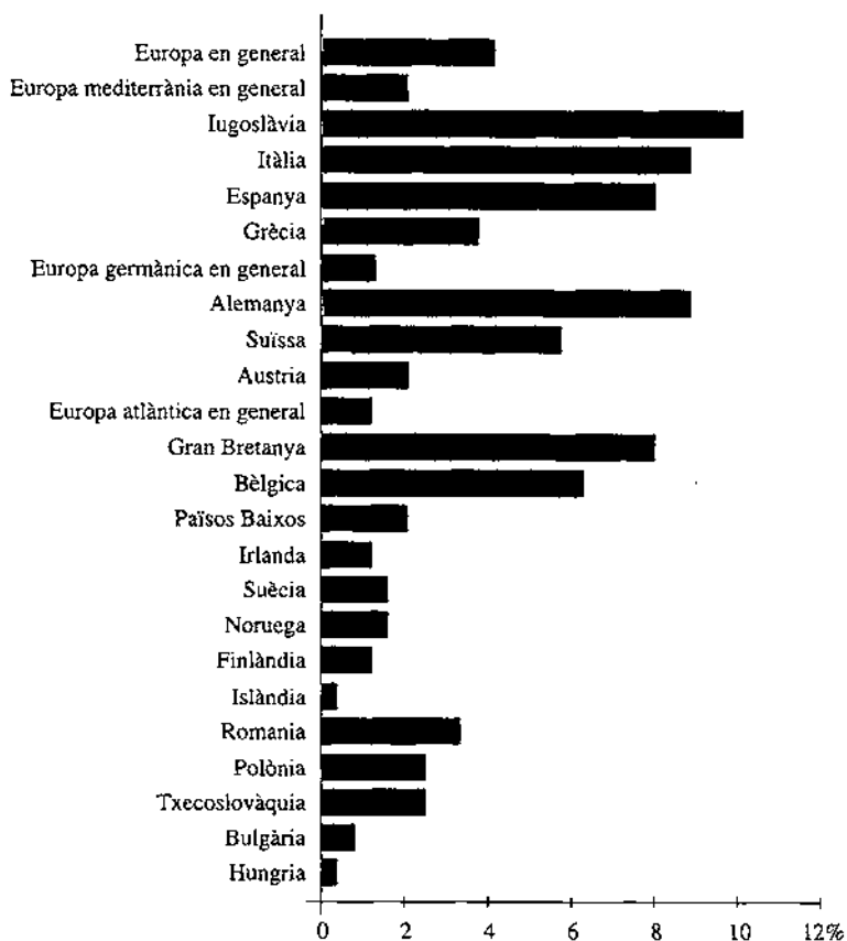
Gràfic 2. L'interés per Europa

Nota: la resta de països tenen unes dades infimes o nul·les.