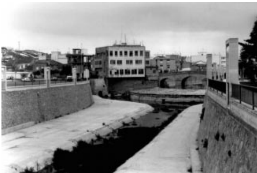
Foto 6. Rojas. Amplios espacios urbanizados en ambas márgenes. Potenciación del patrimonio (puente del siglo XVIII y rueda hidráulica). 1996.