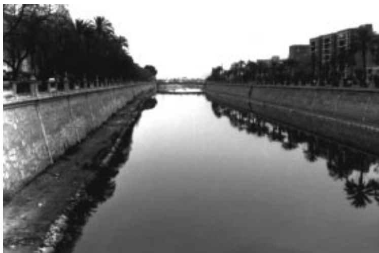
Foto 3. Murcia. Canalización tramo este. Construcciones separadas del río por vías de comunicación, más amplias en la margen derecha. Al fondo, en el cauce, presa para mantener la lámina de agua que recuerda la condición de río del Segura. 1996.