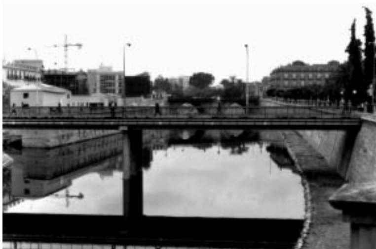
Foto 1. Murcia. Canalización, Puente Viejo y edificio que engloba los antiguos molinos junto al río. 1996.