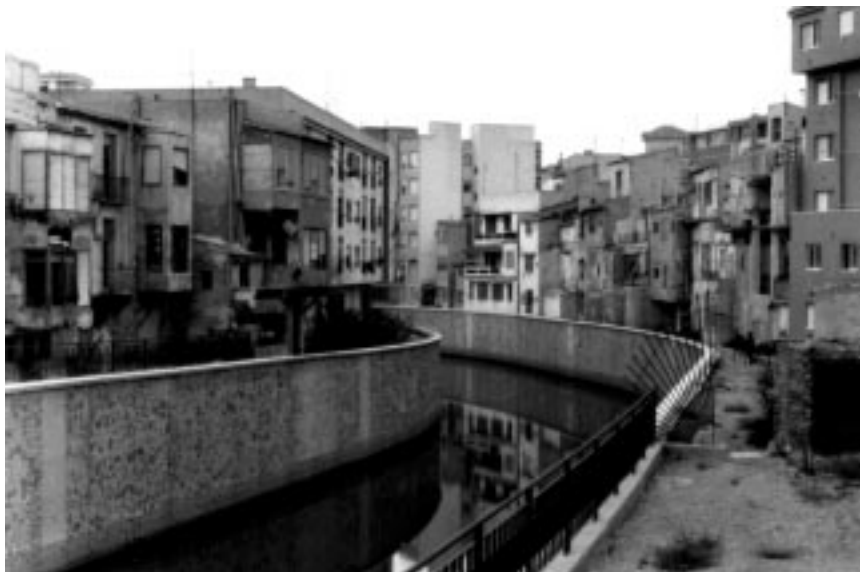
Foto 5. Orihuela. Degradación del caserío en la fachada fluvial. Imposibilidad de circulación paralela al cauce. 1996.