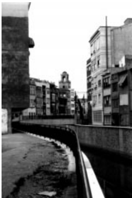
Foto 4. Orihuela. Encauzamiento del río en el centro antiguo (torre de la catedral al fondo). Pequeños espacios ganados en el trasdós de los muros. 1996.