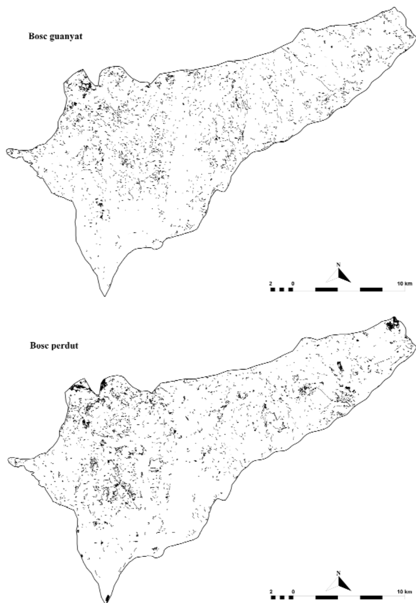
Figura 2. Distribució dels polígons de bosc guanyat i perdut a la zona d'estudi entre els anys 1993 i 2000.