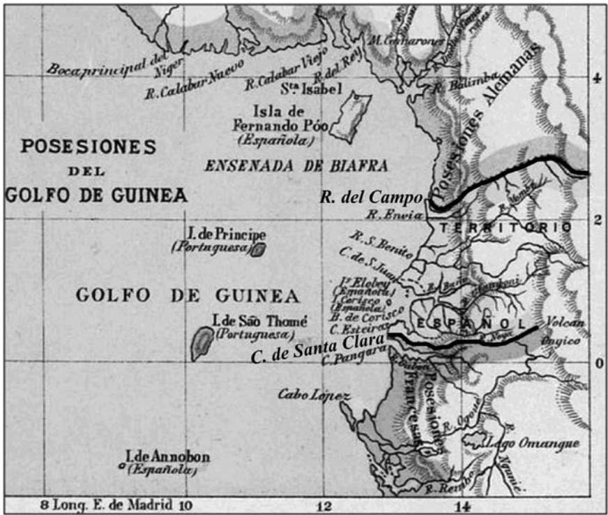
Mapa 1. Espacio costero comprendido entre el río Campo y el cabo Santa Clara, reivindicado por España en la región del Muni conforme a la propuesta realizada por el gobernador José de Barrasa.

Así, el primer episodio se dio cuando el comisario superior de Libreville dirigió dos comunicaciones de protesta a De Barrasa. La primera contra el