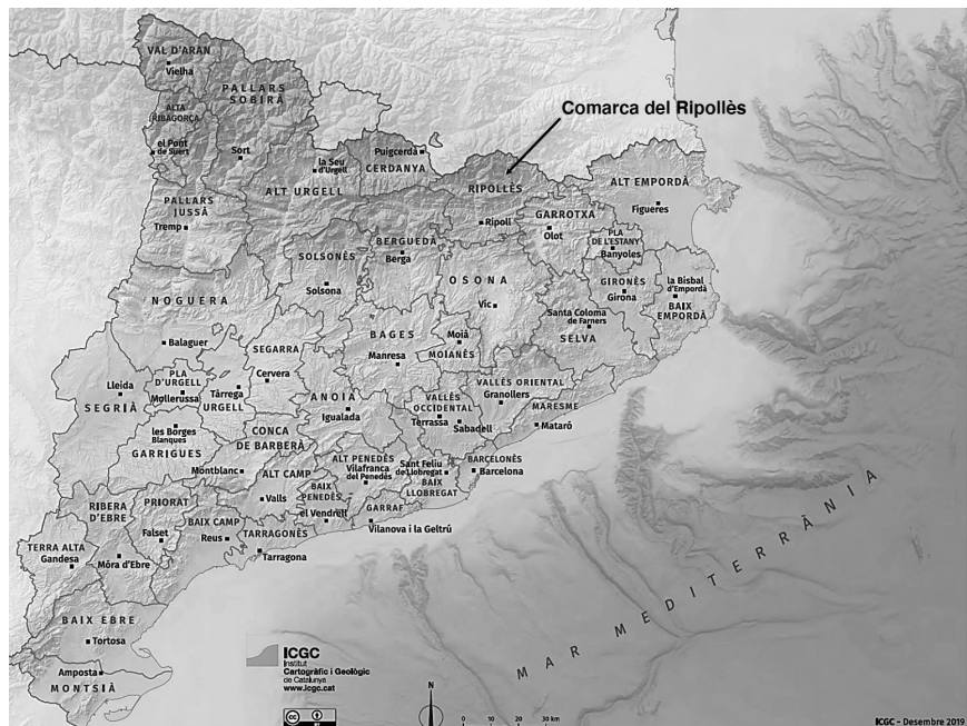
Figura 1. Comarca del Ripollès, on es troba el cas d'estudi, ubicada a Catalunya