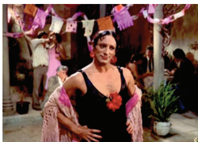
Figura 3: El lugar sin límites

El guión de El lugar sin límites está basado en una novela corta del autor chileno José Donoso. 13 Luis Buñuel, del que Ripstein había sido asistente a principios de los años 60, fue el que le propuso a Ripstein llevar a cabo la adaptación cinematográfica. El personaje principal de la historia, que tiene lugar en el pueblo de El olivo, es el travesti Manuel González, al que se le conoce como “la Manuela”.