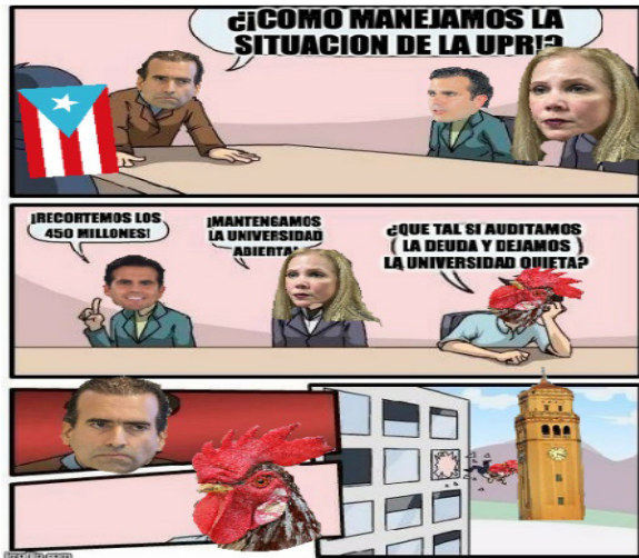
Figura 2. Dialogo

económica del país. Puerto Rico bajo la definición de las Naciones Unidas se encuentra bajo un régimen territorial subordinado al Gobierno de los Estados Unidos.