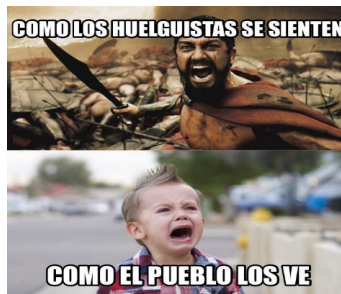
Figura 10: Niños llorones

Las redes sociales tuvieron un rol significativo en la Primavera Árabe, Occupy Wall Street, 15-M, Standing Rock. Estos espacios se han convertido en áreas de congregación y convocatoria para actividades, protestas, y organización comunitaria. Estos activistas luchan desde varios frentes y se posicionan a ambos lados del espectro político social. Durante los sucesos de la huelga sistemática de la Universidad de Puerto Rico del 2017 al igual que durante el 2011 fueron utilizadas por tanto huelguistas como por anti-huelguistas para presentar sus posturas con relación a la huelga (figura 10).