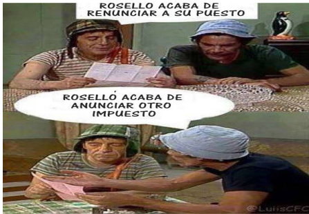
Figura 3: El Chavo y Don Ramón