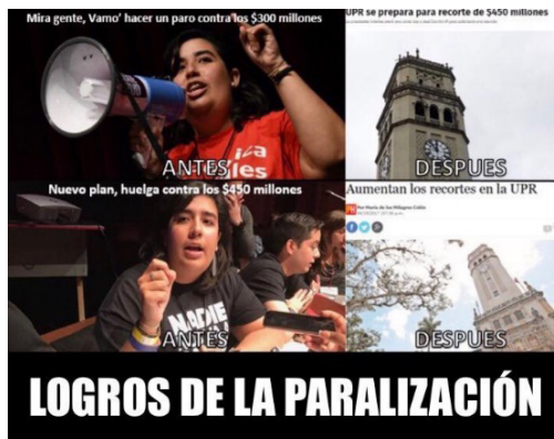
Figura 1. Logros de la paralización

El meme político se caracteriza por ser caricaturesco y crítico, al estilo de la sátira política. Su encarnación de mayor sarcasmo, conocida como dank meme y shitpost en el argot de los cibernautas, posee varias capas de ironía. Este tipo de meme reaccionario e irónico evoca tanto las caricaturas de sátira política de revistas como Punch, como las caricaturas de The New Yorker. Al igual que en la caricatura satírica, los memes funcionan como reacción o comentario político con elementos visuales y textuales que hablan entre si pertenecientes a la cultura popular y al mundo de significados culturales compartido. Se usan como balas para desarticular los argumentos de los contrarios, para reaccionar a sucesos políticos y burlarse de las posiciones de sus contrarios en el espectro ideológico (figura 1).