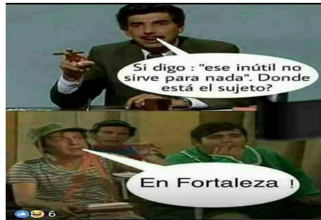
Figura 4: El Chavo en la escuela.

En el primer meme, la imagen nos presenta el mensaje denotado o sea dos hombres en una mesa leyendo un papel, que debido a una familiaridad previa con la serie televisiva reconocemos como el Chavo y don Ramon. En esta imagen vemos al Chavo leyendo de un papel y luego en la siguiente imagen a don Ramon explicándole lo que realmente dice el papel. El Chavo debido a su poca escolaridad (algo que conocemos debido a la popularidad de la serie) lee y entiende: “Roselló acaba de renunciar a su puesto.” Don Ramon ahora con el papel lee: “Roselló acaba de anunciar otro impuesto.” Notemos la similitud fonética entre renunciar a su puesto y anunciar otro impuesto. El siguiente meme (figura 4) presenta la misma composición: dos fotografías de stock sobrepuestas con un texto en burbuja. En la primera se encuentra un hombre en su escritorio con un cigarro que reconocemos como el profesor Jirafales y en la segunda a unos adultos vestidos de niños o sea a el Chavo y sus