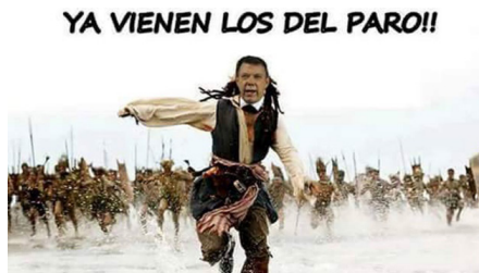
Figura 9: ¡Ya vienen los del paro!!