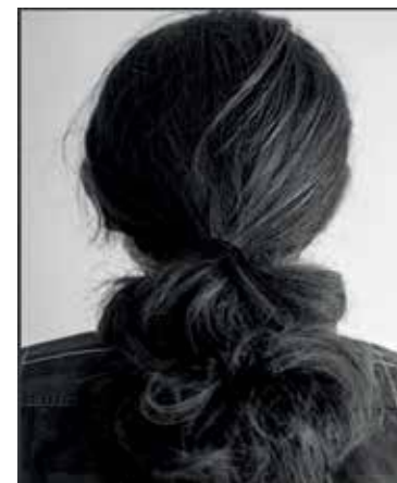
Figura 2. Portada La Circular n. 3