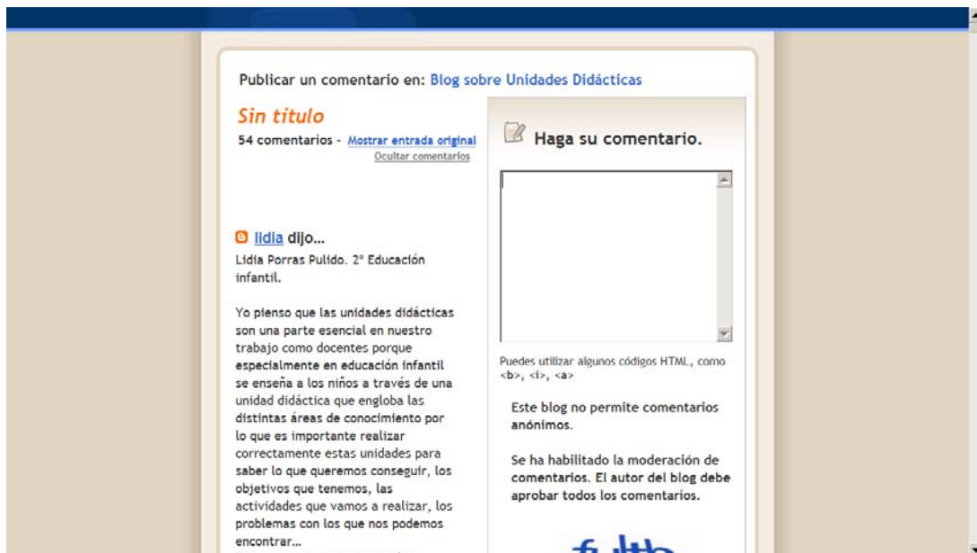
Figura 3. Comentarios enviados por los estudiantes de la Asignatura de Didáctica General. U.R.L. https://www.blogger.com/comment.g?blogID=8553126494105133430&postID=820555260075772761 .

Paso 3: Interpretación e inferencia: Finalmente, el proceso de análisis de los datos se completará con una tercera etapa en la que se procede a la interpretación de las diferentes unidades de información categorizadas. Una vez codificados los datos, se procede a su tabulación, esto es, a la ordenación sistemática en tablas y presentación de manera gráfica, para facilitar la siguiente fase de interpretación y explicación de los resultados, que se efectuará a continuación.