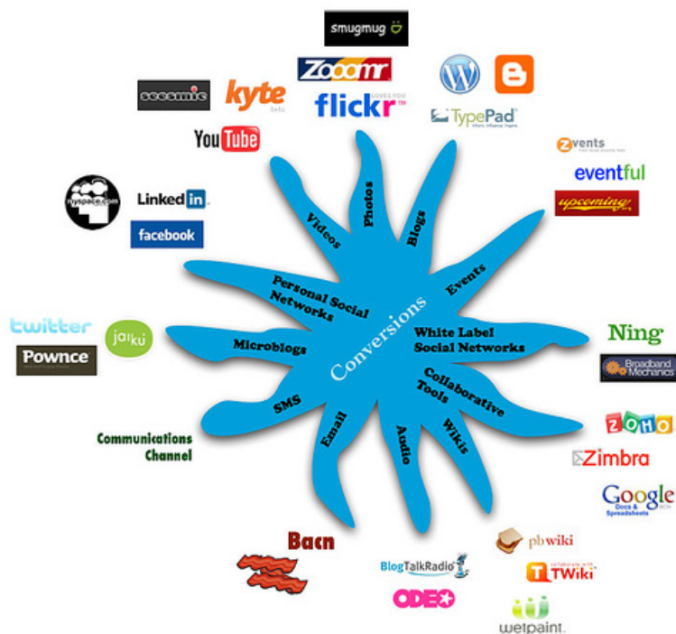
Figura 1. Diferentes aplicaciones de la Web 2.0.

Debido a estas características, se ha señalado que la emergencia de la web 2.0 representa una revolución social, más que una revolución tecnológica. No se trata tanto de una tecnología, como de una “actitud”, la cual consistiría, básicamente, en el “estímulo a la participación a través de aplicaciones y servicios abiertos” (DOWNES, 2005; O'REILLY, 2005). Como se muestra en la figura 1.