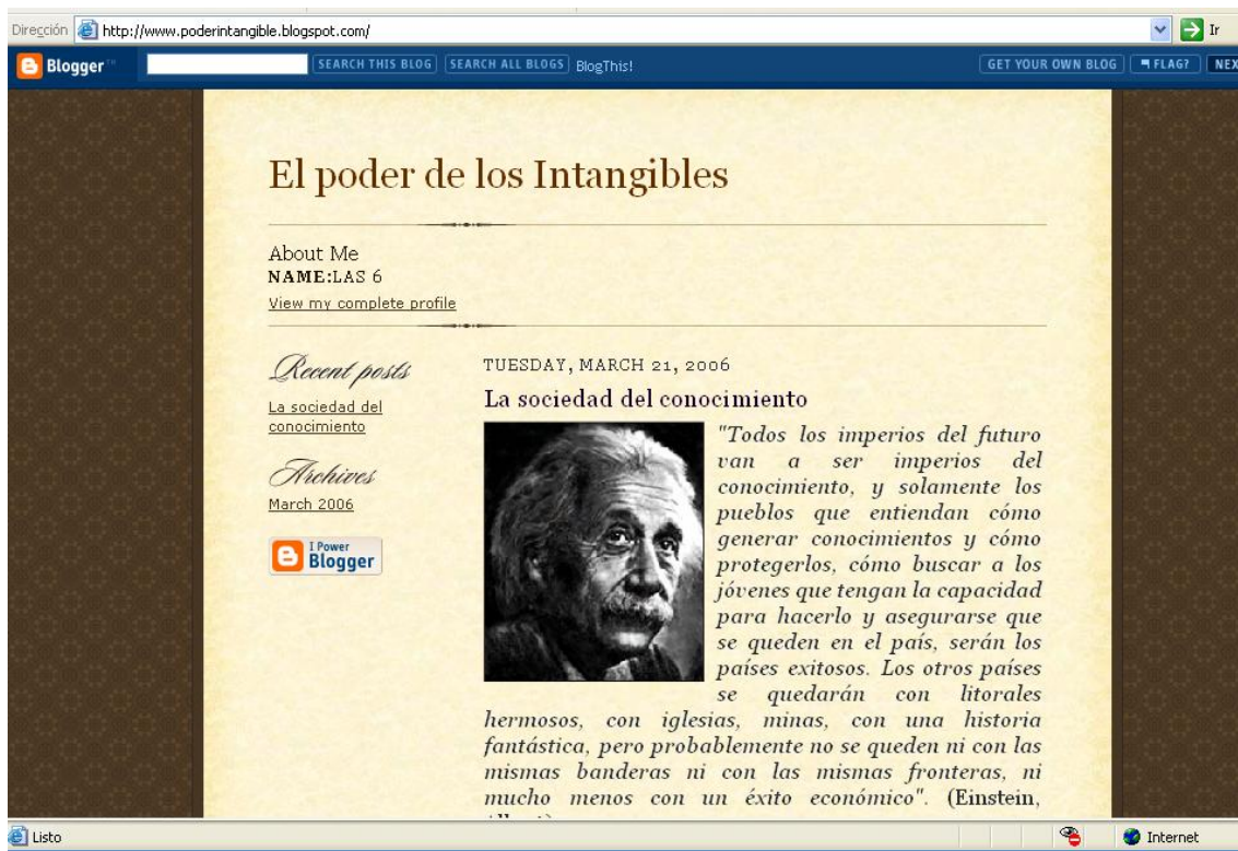
Figura 1: Weblog titulado "El poder de los intangibles". El primer artículo escrito, La Sociedad del conocimiento .