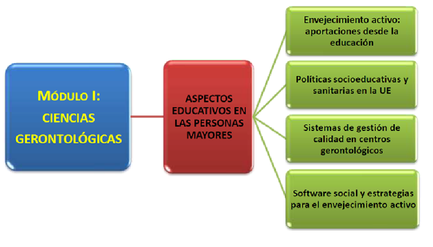
Esquema 1. Organigrama del Módulo I: Ciencias Gerontológicas

La investigación educativa consistía en plantear al estudiantado una reflexión introspectiva a través de nubes de conceptos sobre los principales aspectos que caracterizan la Vejez, con la aplicación social Wordle ( http://www.wordle.net ). Este software social permite diseñar nubes de etiquetas ( tag clouds ) de forma dinámica y fácil a partir de los conceptos que se le indica.