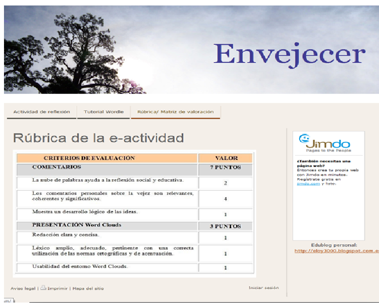
Figura 2. Matriz de valoración de la e-actividad

También, se diseñó una rúbrica para valorar la e-actividad, se recoge en la figura 2.