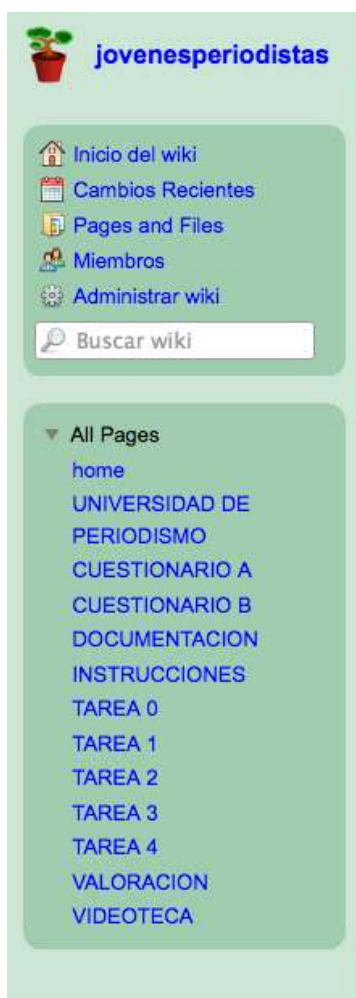
Figura 3. Detalle del menú de la wiki

En esta fase, además de preguntar también por nombre, apellidos y fecha de realización con el fin de poder relacionar las respuestas con los participantes, les preguntamos de manera abierta por todo lo que han aprendido sobre los grupos mediáticos, y en general sobre todo lo que han aprendido durante la actividad. Les pedimos que marquen los géneros periodísticos que hemos trabajado y que nos indiquen cuál sería el más apropiado para cubrir una información determinada. Además, incluimos unas preguntas sobre dos de las tareas que han realizado con el fin de comprobar qué han aprendido en éstas. Les planteamos como parte de la última tarea de la experiencia y en parte como evaluación final de los contenidos que les hemos enseñado. A nosotros también nos sirve como prueba para detectar cambios que se hayan podido dar a lo largo de la experiencia en Jóvenes Periodistas.