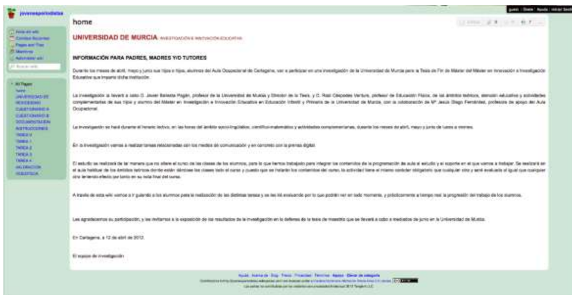
Figura 2. Captura de la página de bienvenida de la wiki

Además de estos apartados, nosotros incluimos los que consideramos necesarios para poder llevar a cabo nuestra experiencia. Tenemos un apartado en el que se agrupan los artículos que los alumnos generan en las tareas, el pre-test y el post-test que hemos pasado para recoger datos para luego analizar e interpretar en busca de posibles cambios tras la experiencia en la wiki, un apartado de documentación en el que los alumnos van a crear su propio libro de texto con el que fundamentar su trabajo, las cinco tareas que se le asignaron a lo largo del trimestre, un apartado donde están publicados los resultados y registro de actividad de los alumnos, y por último un banco de vídeos seleccionados según su idoneidad para las tareas. A continuación procedemos a explicar de manera más detallada cada uno de los apartados.