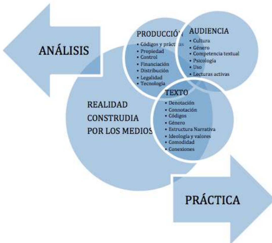
Figura 1. Esquema conceptual de la Educación para los Medios de Comunicación (Area, 1998)

(Masterman, 1993, p. 36). Partiendo de aquí, intentamos que nuestros alumnos adquieran recursos para poder empezar a consumir medios con una actitud crítica y personal, de forma activa, sin dejar que éstos actúen por sí mismos, “la educación para los medios tiene que dirigirse a incrementar el conocimiento del alumno sobre cómo funcionan los medios, cómo producen significado, cómo están organizados, cómo son parte de la industria de la construcción de la realidad y cómo esa supuesta realidad ofertada por los medios es interpretada por quienes la reciben” (Masterman, 1993, p. 184). Siguiendo entonces el trabajo de Masterman, establecemos tres ámbitos para trabajar los medios de comunicación: el texto, la audiencia y la producción. Cuando hablamos de texto nos referimos a los productos de los medios y trabajamos el tipo de texto, sus significados connotativos y denotativos, así como su estructura, valores implícitos y conexiones con otros textos. Respecto a las audiencias del texto, enseñamos a los alumnos a identificar el tipo de audiencia a la que se dirigen los productos “si importante es la tarea de desentrañar a quién se dirige un texto, más aún lo es formar al alumno como consumidor activo y crítico de los textos mediáticos” (Area, 1998, p. 66). La producción atenderá a todo lo referente a la elaboración del texto, los medios que se utilizan para elaborarla, los intereses que hay detrás, las empresas que poseen los medios, cómo se organiza y qué lenguaje usa.