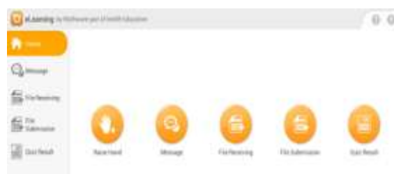
4- Pantalla principal del eLearning dels alumnes

Després de conèixer la metodologia de les classes i dels deures, és hora de explicar els exàmens i els treballs. Els exàmens a aquesta aula es feien de dues maneres: amb el mètode tradicional i amb la tablet. El primer mètode no és objecte de la nostra investigació i per tant, no es va a explicar. El que ens interessa és el segon i funcionava de la següent manera: Com les editorials encara no estan preparades al 100%, no es disposa de models d'exàmens adaptats per a fer-los a la tauleta i, per tant, si es vol usar aquesta eina ha de ser el popi mestre qui els prepare i els adapte a aquest dispositiu. Per poder fer-ho, ha de preparar exàmens tipus text o exàmens amb respostes concretes i usar una eina anomenada: Quiz que es troba a l'aplicació eLearning. Aquesta és la mateixa on es troba el control d'aula i des d'on el mestre ho controla tot, d'on envia missatges als alumnes, etc. (Imatge 4).