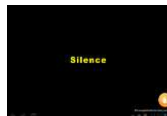
2- Pantalla de la tablet bloquejada pel professor

El mestre connecta la seua tauleta amb el projector amb la finalitat de projectar el seu llibre de text per si, durant la seua explicació, necessita recolzar-la assenyalant algun aspecte del llibre. Si durant algun moment de la explicació el mestre se n'adona que els seus alumnes estan despistats, distrets o fent alguna altra cosa, amb el control d'aula pot silenciar (bloquejar) totes les tauletes o aquelles que ell vulga i fins i tot pot apagar-les (Imatge 2). D'aquesta manera es pot controlar que tots els alumnes estiguen atents sense necessitat de parar l'explicació i molestar a la resta.