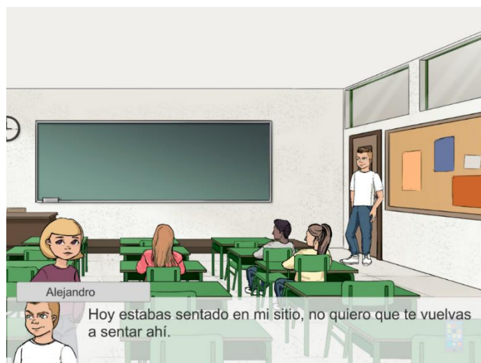
Figura 2 Día 1 en el videojuego Conectado

Como objetivo secundario, el juego pretende enseñar maneras de reducir los riesgos de ser víctima o agresor. Una forma es informando y mentalizando a los jóvenes sobre los riesgos y consecuencias de realizar comentarios o burlas en redes sociales o la subida de imágenes a las que cualquiera puede tener fácil acceso. Otra ventaja del videojuego es que refleja el aspecto social del problema, ya que el ciberacoso afecta no sólo directamente al acosado sino también a su entorno [2], [3], el cual puede ser representado de una forma eficaz en un lenguaje y medio que los jóvenes entienden cómo propio.