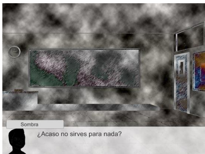
Figura 3. Pesadilla del día 1 del videojuego Conectado

Mediante el juego se proporciona esta experiencia común a todos los alumnos, de modo que se puede iniciar un debate posterior supervisado por un profesional (e.g. profesor, orientador). El objetivo es hacer reflexionar a los jugadores en base a esta experiencia y que comprendan mejor las consecuencias últimas de sus actos. Además así es posible resaltar aspectos como la importancia de pedir ayuda en los casos de (ciber)acoso (y presentándolo como un acto de valentía y no de “ser un chivato”) o destacar lo importante que es la comunicación con los padres [4] así como evitar ser un observador/colaborador que mira a otro lado (y que son participes involuntarios pero necesarios en estos procesos de acoso).