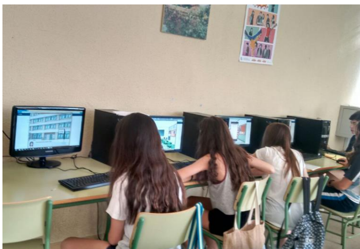
Figura 5 Sesión de experimentos en un instituto de Madrid

El videojuego Conectado ha sido utilizado en tres centros educativos distintos situados en Monreal del Campo, Teruel, en Madrid, y en Zaragoza.