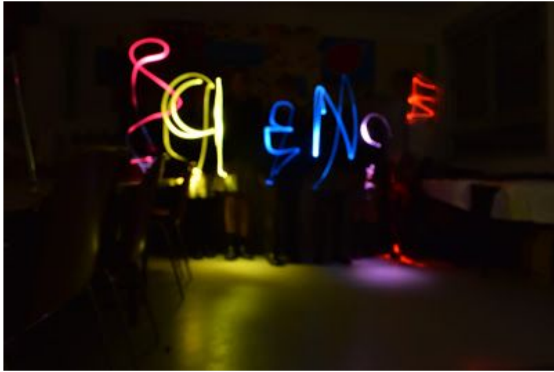
Niños de 6º de primaria. 11-12 años. Colegio Internacional Aravaca.