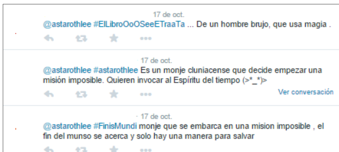
Imagen 2. Ejemplo de la actividad 2

Tras tener ellos el libro en sus manos, es decir, una vez que lo habían manipulado, tenían que escribir en Twitter un pequeño resumen con un máximo de 140 caracteres de lo que creían que tratará el libro tras haber visto la portada. Es decir, queríamos ver la capacidad de síntesis que tenían ellos.