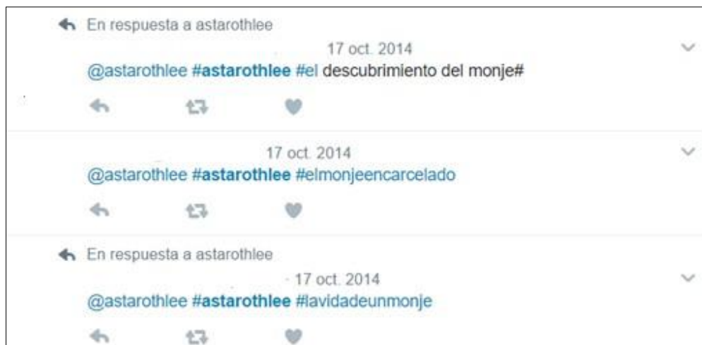
Imagen 1. Ejemplo de la actividad 1

Tras enseñarles la portada del libro sin e título, en Twitter tenían que crearle uno a través de un hashtag. Esta se hacía individual, aunque algunos alumnos no tenían una cuenta registrada en esta red social y por eso, se hicieron en pareja.