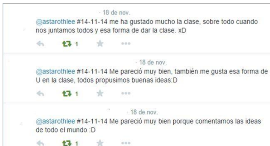
Imagen 4. Ejemplo de la actividad 4

Esta actividad se realizaba en todas las sesiones pues pretendíamos que en Twitter comentasen qué les había parecido la clase de lectura de esa semana y las actividades desarrolladas. Incluso, podían indicar algunos aspectos de mejora que se tenían en cuenta para las sesiones posteriores.