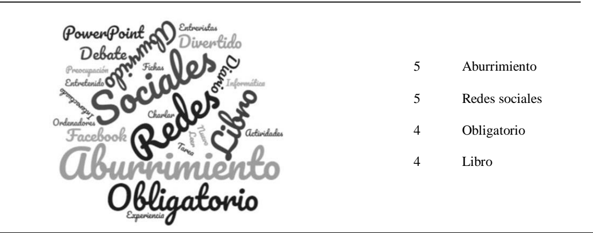
Figura 1. Valoración de las clases de lectura

Ellos indicaron que había sido un aburrimiento porque se había incorporado un libro que no les había gustado. Por contrario, destacaron de forma positiva la incorporación de las redes sociales en las actividades porque se usaron herramientas que ellos utilizan habitualmente. Incluso, nos comentaron que les gustaría incluir esas redes sociales en los contenidos teóricos de lengua y literatura.