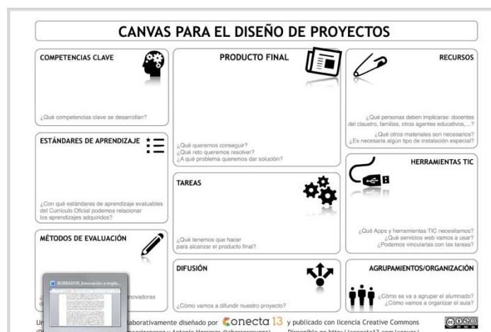
Figura 4. Herramienta para el diseño de proyectos educativos.

correspondiente a la Educación Primaria en Andalucía. Para ello se ayudaron de la herramienta de diseño CANVAS.