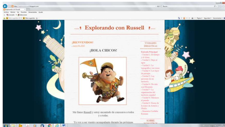
Figura 1. Captura del blog de aula.