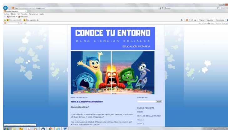
Figura 3. Captura del blog de aula.