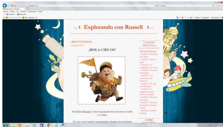
Figura 1. Captura del blog de aula.