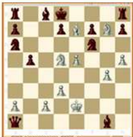
Posición final de La Inmortal.

LA INMORTAL Apertura: Gambito de rey. 1.e4 e5 2.f4 exf4 3.Ac4 Dh4+ 4.Rf1 b5 5.Axb5 Cf6 6.Cf3 Dh6 7.d3 Ch5 8.Ch4 Dg5 9.Cf5 c6 10.Tg1 cxb5 11.g4 Cf6 12.h4 Dg6 13.h5 Dg5 14.Df3 Cg8 15.Axf4 Df6 16.Cc3 Ac5 17.Cd5 Dxb2 18.Ad6 Dxa1+ 19.Re2 Axx1 20.e5 Ca6 21.Cxg7+ Rd8 22.Df6+ Cxf6 23Ae7++ (10).