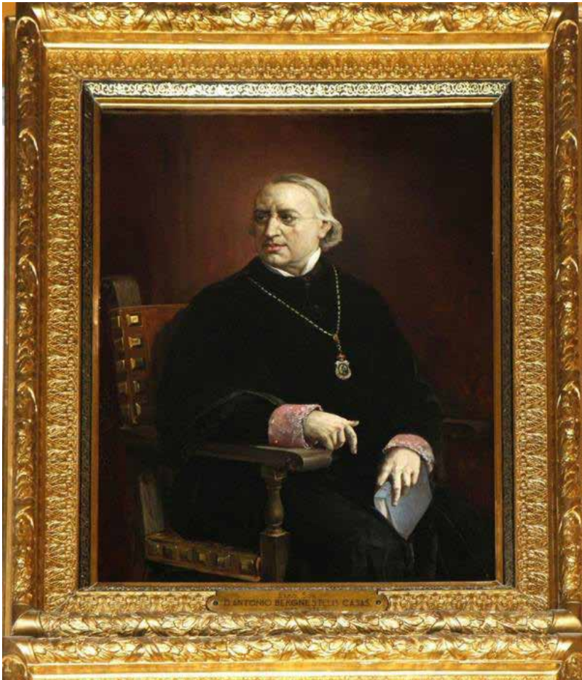
Figura 2. Retrato de Antoni Bergnes de las Casas, obra de Martí Alsina, situado en la galería de retratos de rectores del edificio histórico de la Universidad de Barcelona (post. 1879).

En la primera mitad del siglo XIX el helenista, impresor y divulgador científico Antoni Bergnes de las Casas, y el naturalista Agustí Yáñez, difundieron el evolucionismo de Lamarck en diversas publicaciones barcelonesas.