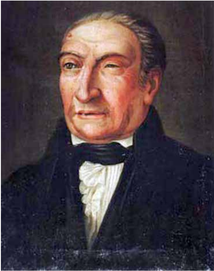
Figura 1. Retrato al óleo de Antoni de Martí i Franquès pintado por el académico Josep Arrau, que se conserva en la Reial Acadèmia de Ciències i Arts de Barcelona (circa 1835).

de Amigos del País 14 , participó en la creación a principio de siglo XIX de la Real Academia de Dibujo y Náutica, y en los esfuerzos hechos durante el trienio liberal para reestablecer en la ciudad estudios universitarios 15 . Asimismo participó en algunos proyectos de notable valor comercial para