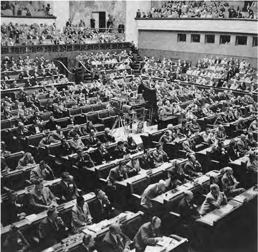
Fig.1. Sesión inaugural de la Primera Conferencia de Ginebra, 1955.

político internacional al uso de la energía atómica y puso en circulación tres mensajes claves: a los posibles usos civiles, añadieron las ideas de apertura y democratización de la información científica y tecnológica relacionada con lo nuclear y sus posibles —y deseados— intercambios.