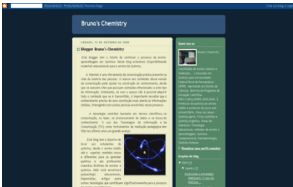
Figura 2. Blog Bruno's Chemistry (quimicadobruno.blogspot.com).

Ressaltamos que a escolha do blog “Bruno's Chemistry” foi também devido ao conteúdo explorado pelo blog. Nele o professor/autor do blog utiliza-o com seus alunos de química como complemento da aula exposta e deposita os conteúdos vistos na sala de aula, e também conteúdos que acrescentam ao ensino aplicado em aula.