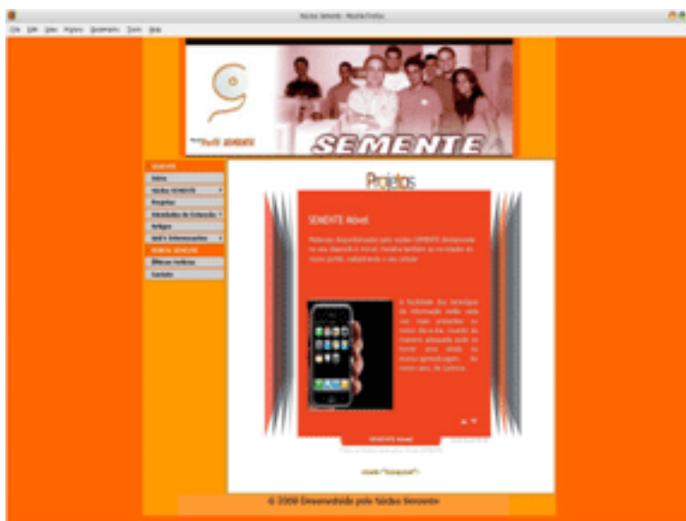
Figura 3. Portal do Núcleo SEMENTE (www.semente.pro.br).

O Portal SEMENTE segue a tendência da evolução da Web, onde a interação do criador com usuário é cada vez mais intensa. Neste sentido, a utilidade do Portal está principalmente no poder de interatividade e no acesso a ambientes virtuais, permitindo oferecer aos usuários interação e motivação, para o processo de ensino-aprendizagem. O Portal SEMENTE teve sua escolha reforçada, por nele estarem inseridos diversos conteúdos que utilizam os recursos da Web 2.0 para o ensino de ciências.