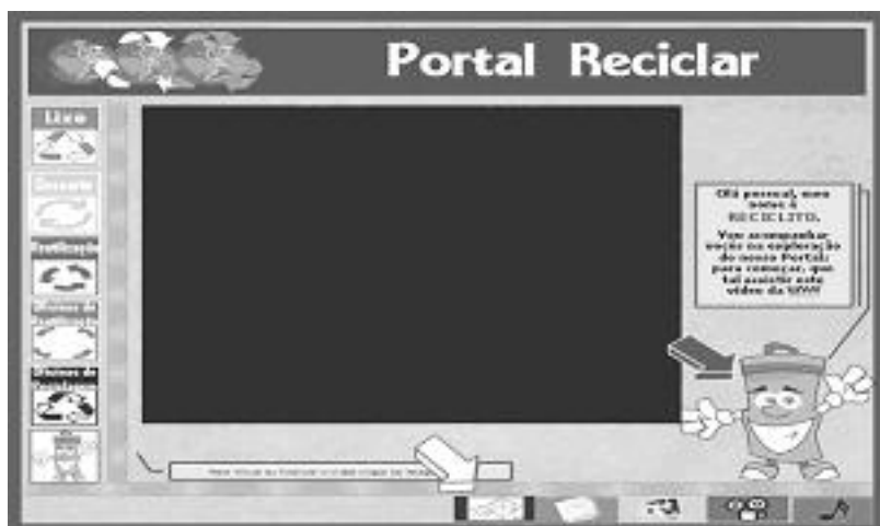
Figura 2. Página inicial do Portal Reciclar

Na busca de dados para avaliar o Portal Reciclar foi planejada e desenvolvida uma sequência didática para o ensino de Química tendo como tema transversal a educação ambiental. Participaram da investigação 28 alunos e a professora da turma da primeira série do ensino médio de uma escola da rede pública, Brasil.