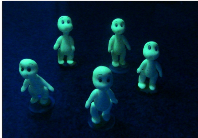
Fig. 2. Imagem de bonecos fosforescentes, após excitação em lâmpada incandescente.

Os bonecos foram levados à sala envolvidos, individualmente, em papel de alumínio para que não absorvessem luz. Numa bancada a frente da turma sob fraca luz ambiente desenrolou-se dois bonecos e a iluminação foi interrompida. Nesse momento, não houve a fosforescência, pois os bonecos estavam há 24 horas protegidos da exposição à luz. Em seguida, as lâmpadas foram religadas. Foram colocados os bonecos próximos a uma lâmpada de 60 Watts de filamento de tungstênio, disposta em uma luminária, por aproximadamente dez segundos e apagaram-se todas as lâmpadas da sala. Foi proposto aos grupos de alunos que explicassem o fenômeno de fosforescência observado (figura 2).