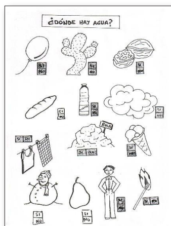
Figura III.4: Actividad 6.