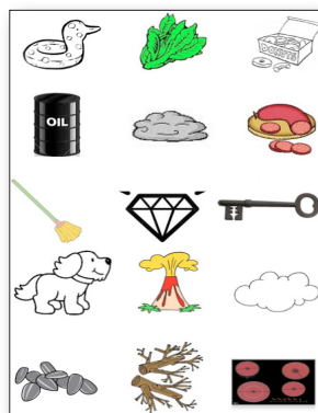
Figura III.6: Actividad 22.

Con el mismo objetivo que en la actividad 6, conformando una actividad de cierre, se usan dibujos para detectar la presencia de agua en diferentes elementos. Hemos modificado los elementos representados para provocar un relativo cambio de contexto.