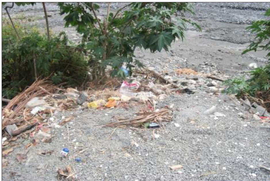
Fig. 1. Observe y describa la imagen que se presenta.

estas figuras, se establecen las condiciones y criterios para la aplicación, el seguimiento y la retroalimentación de los procesos de transferencias de aprendizaje que conducen a la síntesis y la evaluación, procesos esenciales en toda investigación y adquisición del conocimiento científico.