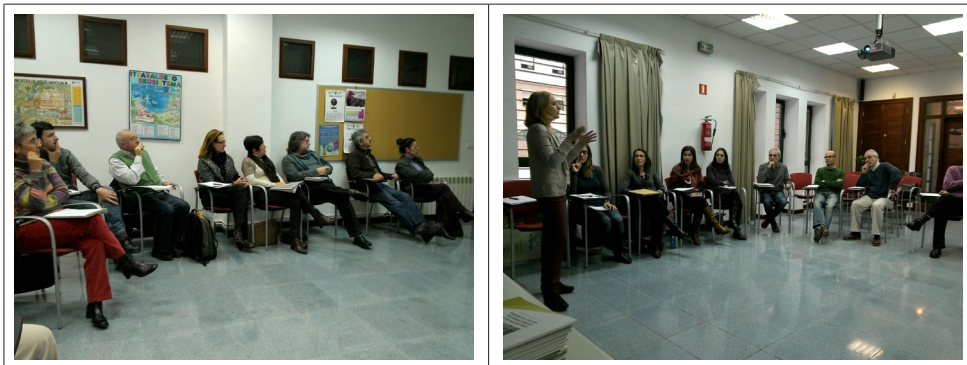
Fig. 1. Jornada de formación de miembros de Ingurugela.

La primera jornada se dirigió a los miembros de Ingurugela (Fig. 1) (Tabla 1). Los centros Ingurugela son una red de apoyo al profesorado y a los centros escolares, que coordinan planes y programas de educación ambiental en el sistema educativo no universitario. Entre sus funciones se encuentra la organización y evaluación de las agendas 21 escolares, así como la formación del profesorado en materia de medio ambiente y desarrollo sostenible y las estrategias didácticas para su enseñanza y aprendizaje.