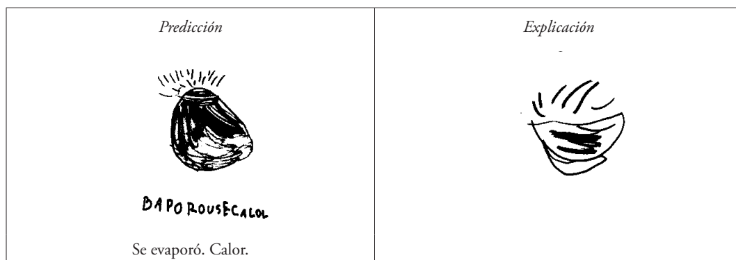
Fig. 2. Respuesta escrita de la estudiante A5