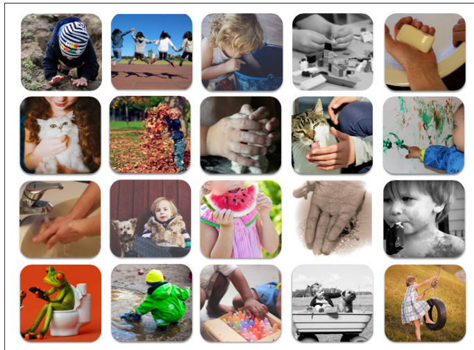
Fig. 1. Imágenes obtenidas de bases de datos libres de licencias ( https://pixabay.com ) y ( https://unsplash.com/ ) que sirven como ejemplo para la actividad 2