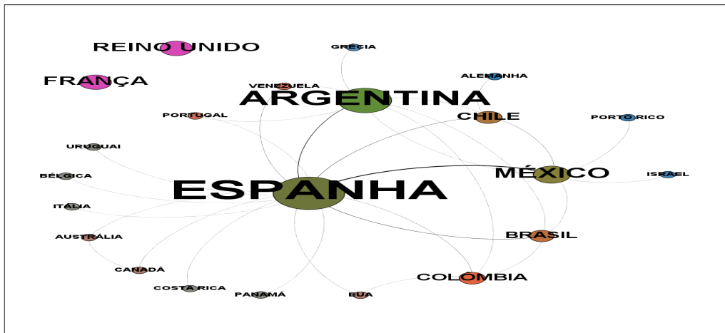
Figura 3: Rede dos países dos autores e coautores.

Percebemos que, praticamente, todos os demais países possuem relações com a Espanha, e em contrapartida, verificamos o “isolamento” apresentado pelo Reino Unido e pela França (pontos superiores sem ligação com os demais), que não possuem publicações conjuntas com pesquisadores de outras nacionalidades. Esta rede nos permite refletir que possivelmente há uma preocupação entre os pesquisadores da área de Ensino de Ciências em agregar a seus estudos peculiaridades de outras nacionalidades, como cultura, experiências e contextos.