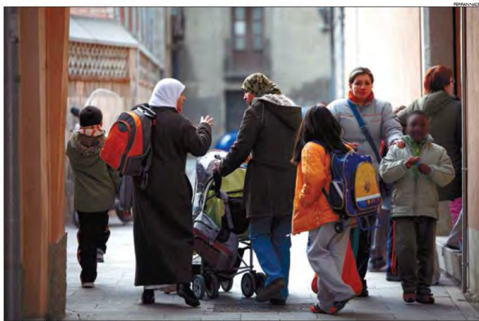
▶▶ Alumnos inmigrantes salen del colegio Santa Caterina, situado junto a la catedral de Vic, ayer por la tarde.

Los centros funcionaran todo el año y quedarán vacios a inicio de cada curso escolar.