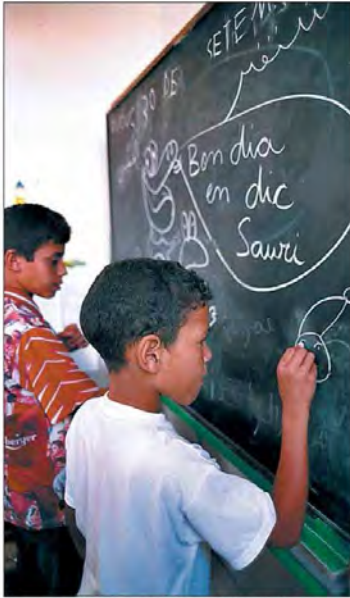
Alumnos extranjeros en un aula de acogida de Terrassa.

Mostra l'acció d'escriure a la pissarra del nen de primer pla, que per l'escrit que veiem a la pissarra ens vol mostrar com aprèn català.