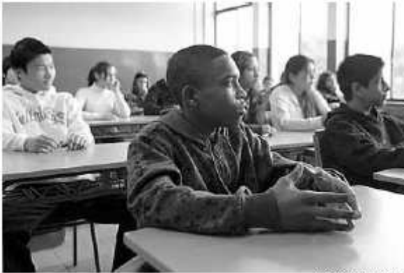
Alumnado que incluye a inmigrantes en un instituto barcelonés

Alumnado que incluye a inmigrantes en un instituto barcelonés.