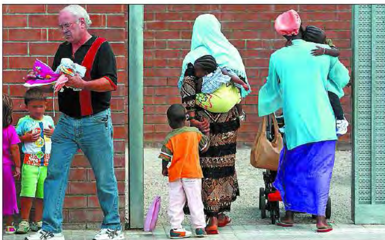
Los alumnos de un centro de educación infantil de Banyoles (Girona) al comienzo del curso.

Los alumnos de un centro de educación infantil de banyoles (Girona) al comienzo de curso .