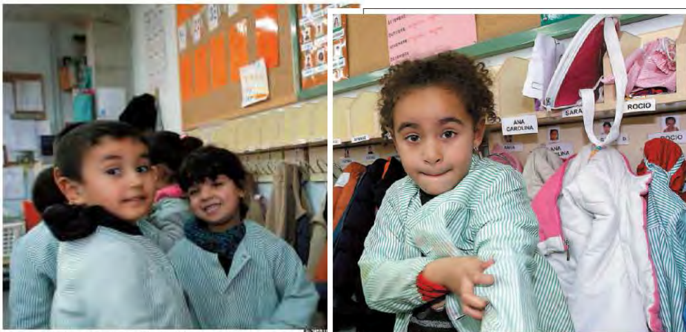
Aulas multiétnicas. El centro de primaria Pompeu Fabra de Reus, el 80% del alumnado es de origen marroquí y en sus pasillos la mezcla de lenguas es casi una Torre de Babel.

Esperanzas y temores ante las aulas para inmigrantes. Los maestros las ven bien mientras sean temporales.