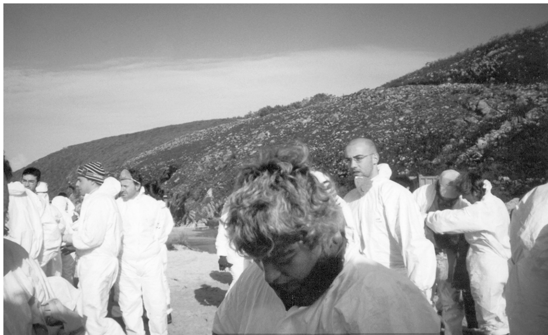
Els voluntaris de l'Autònoma posant-se les granotes i la resta de l'equip per treure "chapapote" a la platja d'O'Grove

Arran de l'àmplia demanda de la comunitat universitària de voler cooperar en les tasques de neteja de les costes gallegues, la UAB i la Universitat Autònoma de Barcelona ha engegat