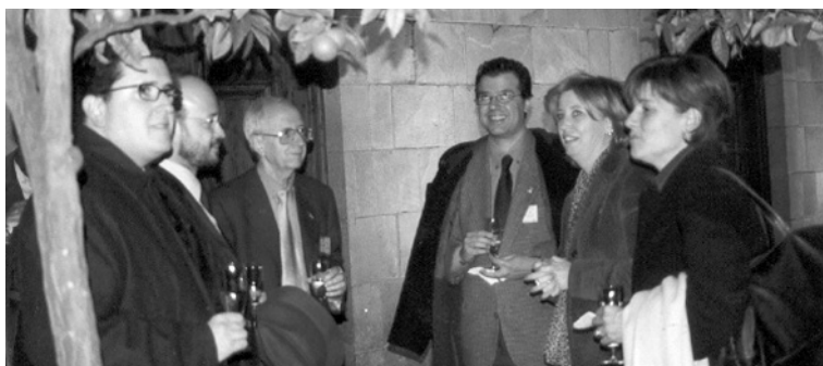
Rebuda de les autoritats al Pati dels Tarongers

Tothom va estar d'acord en que cal regular per llei el dret a les adaptacions curriculars