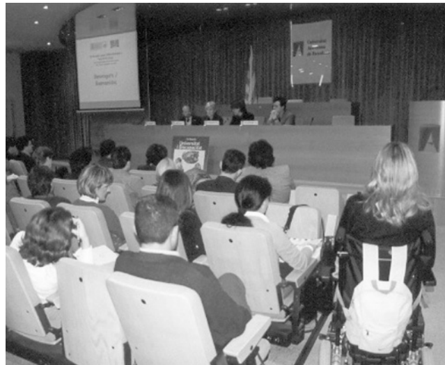
Els simposis es van realitzar a la Sala d'Actes del Rectorat

Aquest acte era el preludi de la celebració de l'any 2003 com a Any Mundial de la Disminució i la culminació del 2002 com el 10è aniversari del PIUNE , el Programa per la Integració d'Universitaris amb Necessitats Especials, un programa de la Fundació Autònoma Solidària que garanteix la igualtat d'oportunitats dels estudiants amb disminució de la UAB.