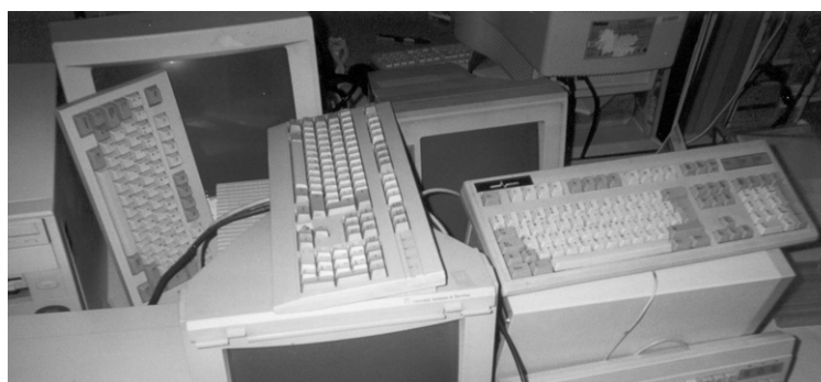
Ordinadors apilats de la millor manera possible