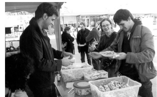
Per un euro i mig, 100 persones van dinar pel Sàhara

S'ha fet arribar un total de 360 kg d'arròs, lleties, sucre i oli als campaments de refugiats de Tinduf