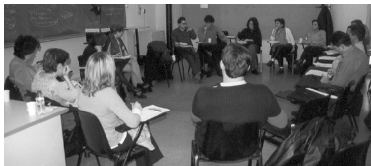
Grup de treball sobre adaptacions curriculars reunit en una aula

El dijous 28 es va iniciar la Reunió, amb un Acte Inaugural de benvinguda a tots els participants. Seguidament es va fer una introducció del que han estat 10 anys d'Integració a les Universitats i es va presentar el cas concret del PIUNE .