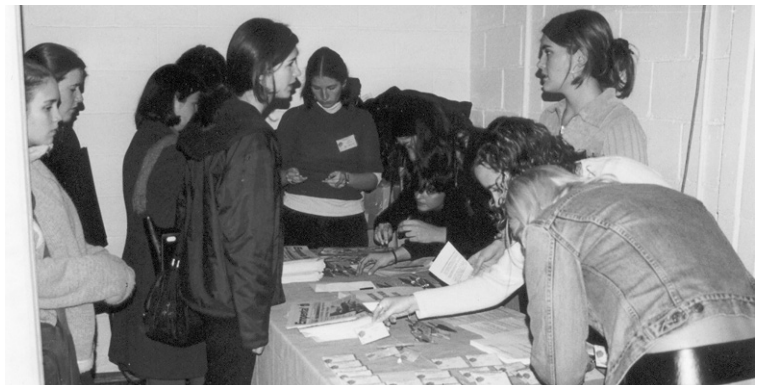
Moment de les inscripcions

El segon dia, en canvi, el protagonisme el van tenir els participants a les Jornades, ja que mitjançant grups de treball d'unes 20-30 persones, van reflexionar sobre alguns dels temes que s'havien tractat el dia anterior i van aportar-hi solucions i aspectes a tenir