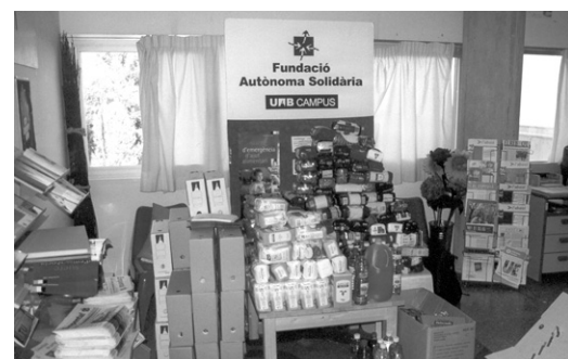
Una part dels aliments recollits.

Pla de Pau, l'obstaculització sistemàtica que fa el Marroc i la manca de fermesa de Nacions Unides i de la Comunitat Internacional. Perquè la ciutadania no és aliena al patiment de la població sahrauí refugiada, la qual necessita l'ajut internacional per poder sobreviure, situació que hauria d'haver finalitzat temps enrere amb la celebració del Referèndum d'Autodeterminació i el retorn de la sobirania als sahraus.