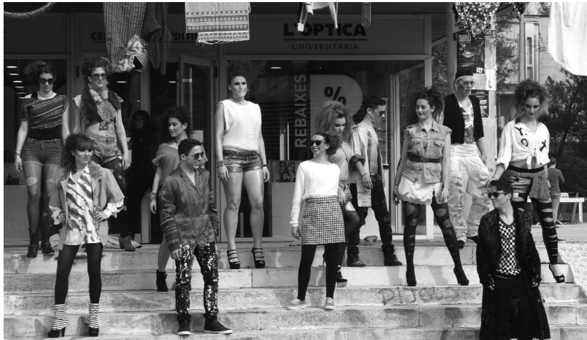
Imatge de la desfilada de roba reciclada Modatrash a la Plaça Cívica.

Grup de voluntariat de medi ambient de la FAS