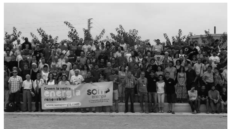
Fotografia de l'equip de Som Energia.

independència respecte de les grans companyies energètiques, i estalviar grans despeses com la publicitat i ser eficients en la gestió i la comunicació.