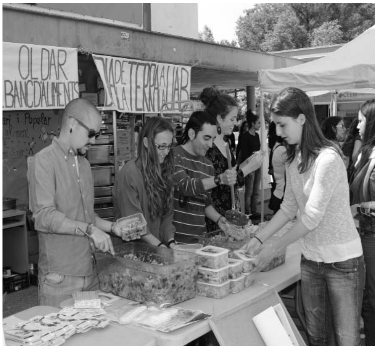
Dinar solidari a la Plaça Cívica el Dia de la Terra.

Conscients d'això, des de la Fundació Autònoma Solidària ja fa temps que treballem amb la idea que el voluntariat de