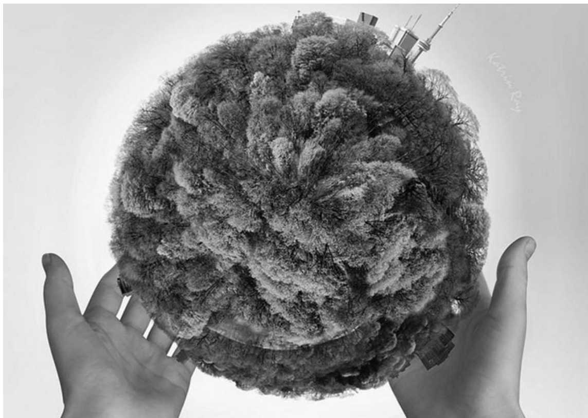
Els recursos naturals són limitats i l'ús que en fem és responsabilitat de tothom.

Si tothom visqués segons l'estil de vida d'un ciutadà de l'Estat espanyol, necessitaríem tres planetes per satisfer la demanda de recursos naturals