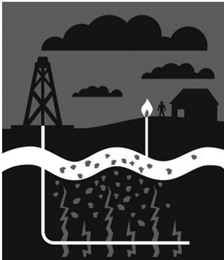
Imatge de la plataforma 'Aturem el Fraking'. Aturem el Fracking .

er i ciment on s'injecta a pressió una barreja de gran quantitat de litres d'aigua, sorra i 596 additius químics de gran toxicitat que aconseguen fer més grans les esquerdes i atraure el gas cap al pou. L'explosió fa pujar el gas cap a la superfície juntament amb una part de la mescla injectada, entre un 15% i un 80%, on es troben metalls pesats, hidrocarburs i elements naturals radioactius.