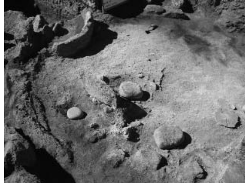
Figura 3. Estructura doméstica 1.

Una de ellas (estructura doméstica 1) (Figura 3) presentó pedazos de roca en la sección NE, presumiblemente se trató de un fogón. Así mismo la otra estructura (doméstica 2) en la sección NE, muy cercano a la pared contuvo restos de un fogón y un pozo