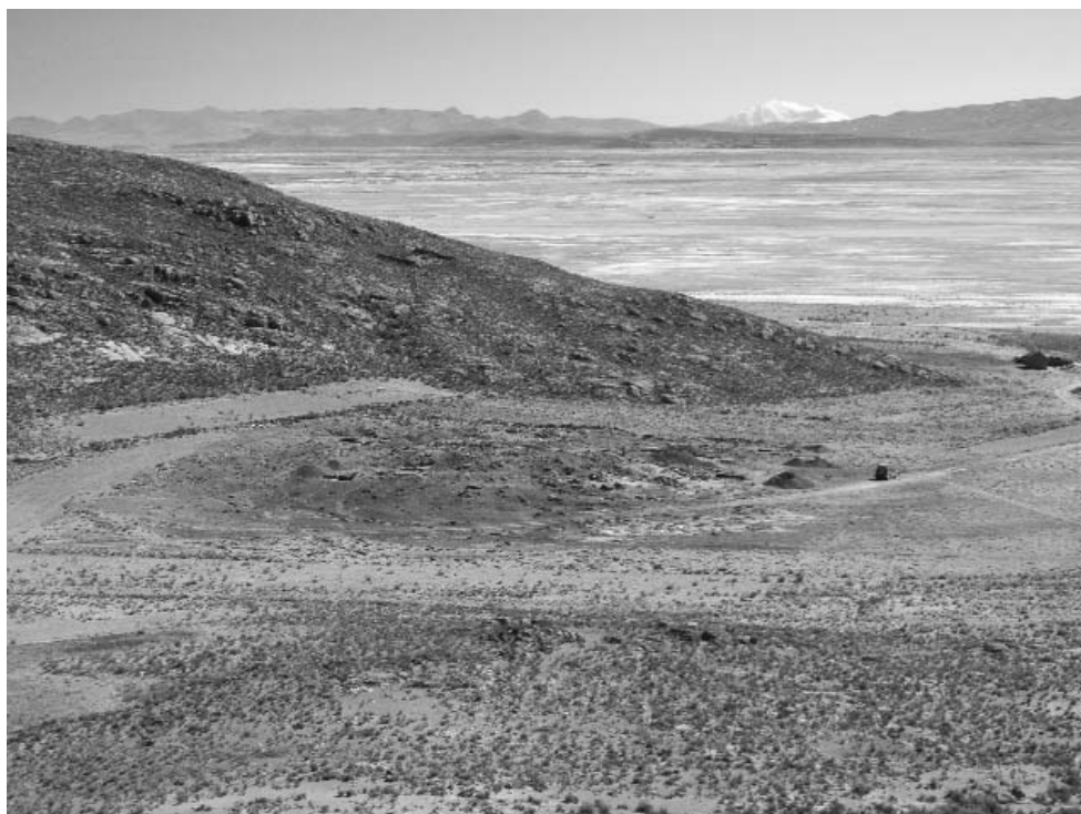
Figura 2. Montículo La Barca.

Este sitio es identificado por Bermann (1992) y el siguiente trabajo de prospección sistemática, se realizaría por Mc Andrews (1998) y las primeras excavaciones realizadas en el montículo, serían las de Rose (2001). Las excavaciones realizadas en el montículo La Barca, nos permiten evaluar los postulados que Bermann (1994, 1995, 1998), propone en el modelo de análisis de unidades domésticas y las variables que pudieran ser claramente identificadas.