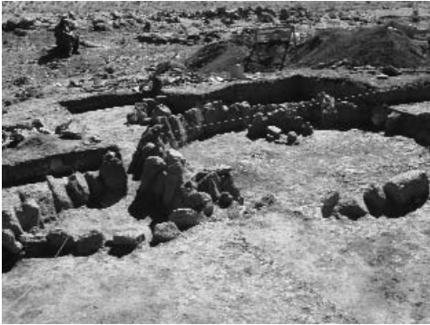
Figura 4. Estructura 2.

1.0 metros de ancho y la cámara oeste tuvo 1.6 metros de largo por 50 cm. de ancho. Estas cámaras contenían el adobe del colapso de la estructura, sin presentar artefactos al interior del mismo.