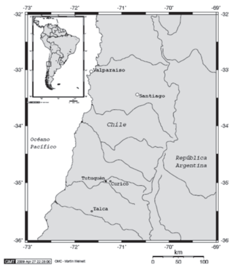
Figura 1.- Ubicación geográfica del Cementerio Arqueológico Tutuquén, Región del Maule, Chile.

El Cementerio Tutuquén 1, con coordenadas 34°58'24 S y 71°16'15 W, se localiza en la vertiente occidental de la zona andina meridional, sobre el valle longitudinal central, entre la Cordillera de la Costa y la Cordillera de los Andes. El sitio se halla dos kilómetros al oeste de la ciudad de Curicó, Región del Maule; en la confluencia de los ríos Teno y Lontué.