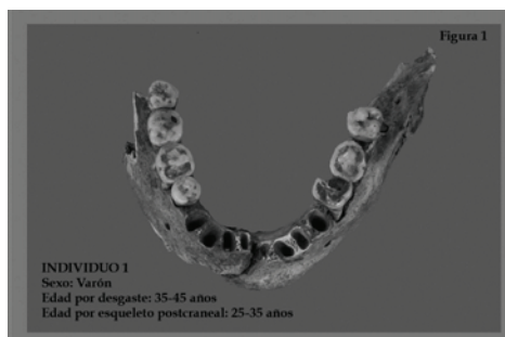
Figura 1.- Mandíbula adulta que presenta un mayor desgaste en la arcada izquierda como consecuencia del consumo de coca.

Esta hipótesis queda apoyada cuando se compara el grado de desgaste entre arcadas, donde se pudo comprobar cómo éste era mayor en la arcada inferior izquierda (Fig.1), lugar donde generalmente se ubica el bolo de coca durante el coqueo, según las fuentes etnográficas y pictóricas.