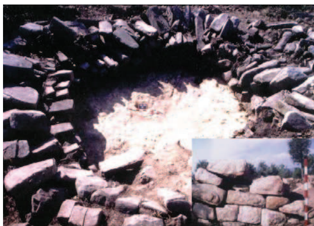
Figura 1.- La Torre del Far de Santa Coloma de Farners.

En aquest darrer indret l'excavació efectuada entre els anys 2004 i 2005 va permetre documentar les restes d'una gran torre circular construïda en el cim del Far (coordenades UTM: 469268/4631557, a 587,7 m.s.n.m.), el punt més elevat de la Serra d'Argimon, en el sector de ponent del municipi de Santa Coloma de Farners i formant part dels estreps orientals de les Guilleries (Fig.1). L'edifici presentava un diàmetre exterior de 9,60-9,80 metres, amb un mur perimetral d'entre 2 i 2,20 metres d'amplada construït amb grans blocs de granit extret d'afloraments immediats que presenten encoixinat exterior (Folch et al., 2008). L'edifici es troba relativament ben conservat, ja que es conserva en tot el seu perímetre i en alguns punts els murs mantenen una alçada d'un metre. L'excavació ha proporcionat pocs fragments ceràmics, encara que força homogenis, que han aparegut tant en els nivells de l'inte-