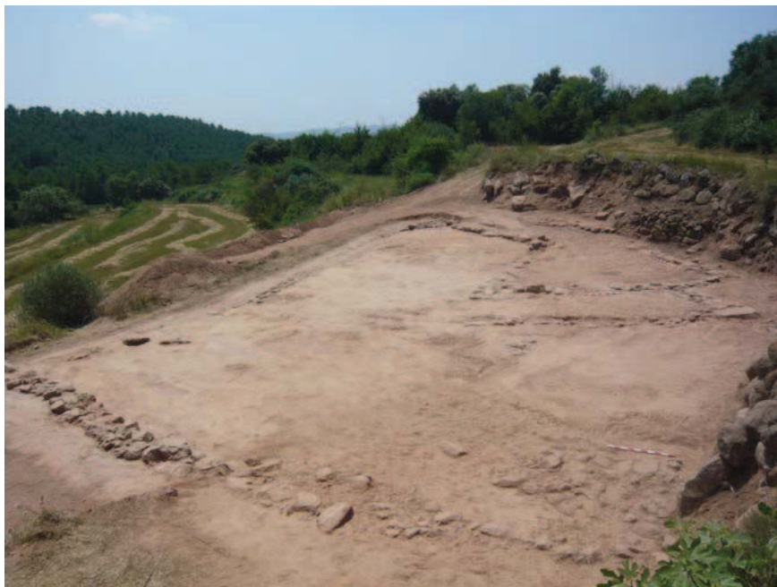
Figura 2.- Estructures delimitades en l'interior del recinte del jaciment de Monistrol de Gaià.

Per sobre d'aquestes estructures es desenvoluparia una nova fase d'ocupació testimoniada per la presència d'algunes sitges i fosses retallades en els nivells anteriors i en el subsòl natural que funcionaria entre els segles IX-XI,