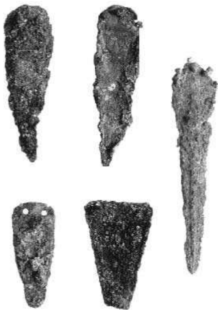
Figura 2.- Puñales de Cerdeña entre el Bronce Antiguo Final y el Bronce Medio inicial (Adaptado de Ugas, 2005)

tiguo Final y el Bronce Medio inicial, son 5 de los 6 puñales (Fig.2) de la tumba de Sant'Iroxi (Decimopotzu), en cobre arsenicado con 2 o 3 remaches (Ugas, 1999), que presentan tres diferentes tipologías: lama triangular biconvexa con márgenes afilados y base redondeada; base simple rectilínea y lama con márgenes cóncavos; larga lama reforzada con una nervadura mediana, con base trapezoidal casi triangular (Ugas, 1999).