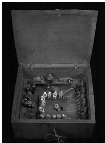
Figura 2. Model de fusta i ivori d'un qasgiq provinent de St. Michael, Norton Sound, Alaska. Jackson Museum, Sitka, núm. de catàleg # II-H-31.

Seguint les explicacions de Nelson (1899: 245-246), al voltant de les parets del qasgiq s'hi podien trobar bancs fets de taulons de fusta que estaven situats a una distància d'entre 90 i 120 centímetres del terra i que tenien prou amplada per dormir-hi i seure-hi. Per tant, unes persones assegudes i unes altres situades al terra dretes o assegudes va ser la manera de cabre-hi ordenadament, tal com podem veure també en la figura 2. Tanmateix, les preguntes interessants a dirimir són: qui podia entrar