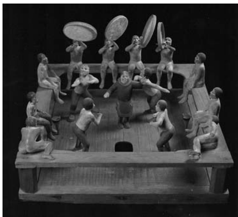
Figura 3. Model de fusta d'un qasgiq amb la representació d'una dansa provinent de la zona baixa del Yukon, Norton Sound, Alaska. Jackson Museum, Sitka, núm. de catàleg # II-H-46.

De danses n'hi havia de diferents tipus i amb diverses finalitats i funcions. Nelson (1899: 387) en descriu vàries en les quals els homes n'eren protagonistes absoluts, i en les quals es feien imitacions dels animals caçats. Tanmateix, a partir d'un dia determinat del BF les dones també tenien accés a dansar dins el qasgiq (Lantis, 1966: 56-57), tot i que cal esmentar que en aquest cas la finalitat era honorar la primera caça que havien realitzat els nens de la comunitat. En una altra referència Nelson també descriu una dansa protagonitzada per quatre homes i una noia, la qual no havia arribat a la pubertat. La